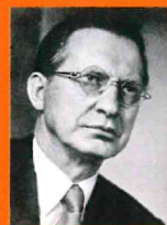
A. De Gasperi

Giovedì 8 Novembre LA CULTURA POLITICA CATTOLICA